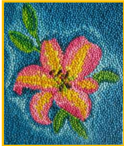
Рис.1 Работа Буториной А.Н