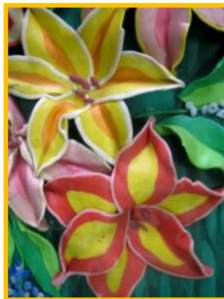
Рис.1 Работа Разгулиной Алены. 14 лет.