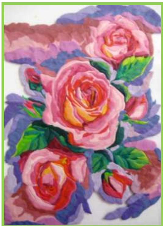
Рис.13 Изнаночная сторона

6. Последний этап – это фон. Здесь я позволила себе поэкспериментировать. После того, как работа завершена, рекомендую почистить стекло тряпочкой с лицевой стороны и вставить его в рамочку. Работа получается в зеркальном отражении. (Рис. 13,14,15,16)