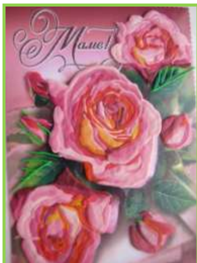
Рис.10 Стекло на открытке

5. Далее постепенно переходим на полутона и тени. После цветов переходим к листьям, зелени. (Рис. 10,11,12)