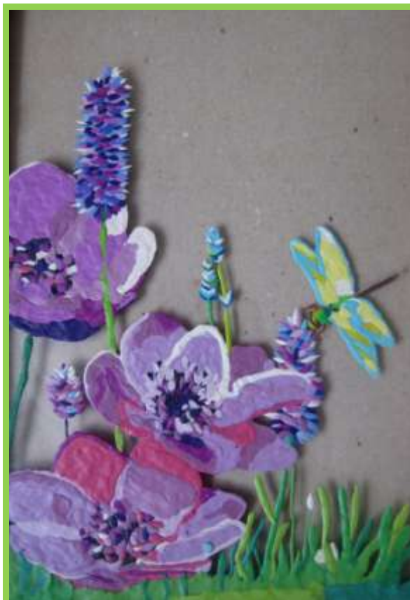
Рис. 2 Изнаночная сторона