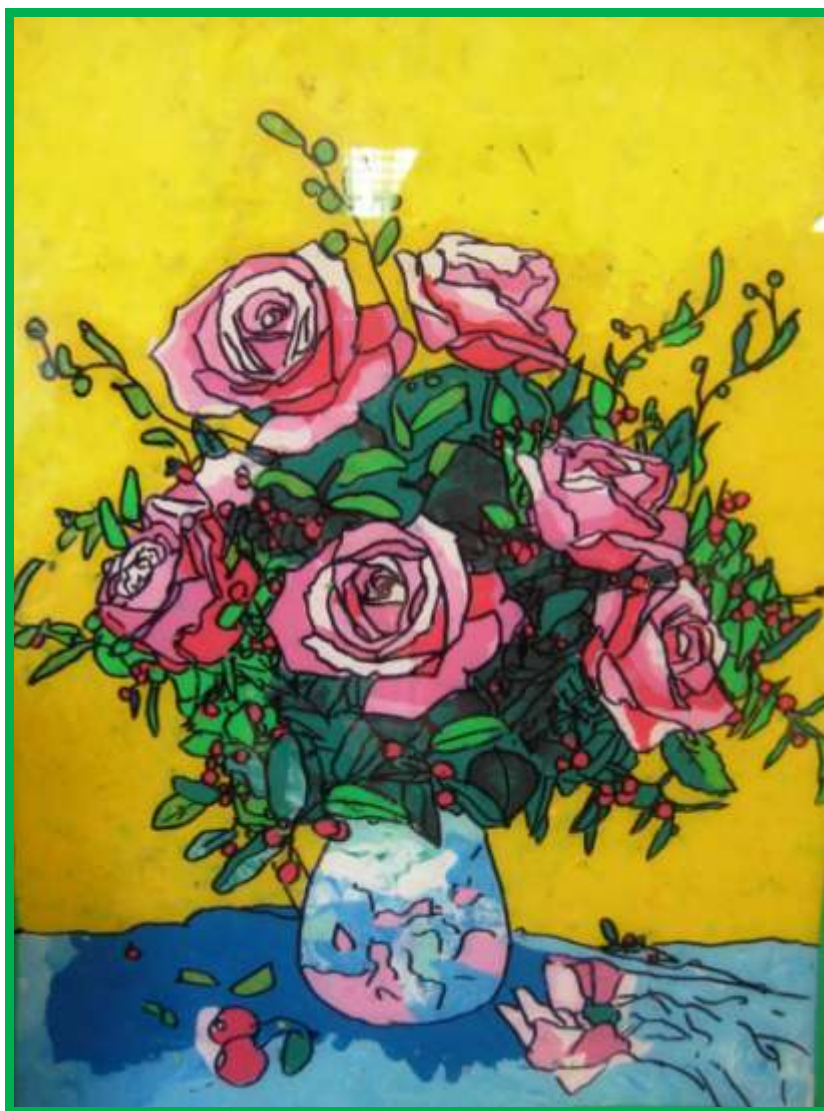
Рис.1 Натюрморт выполнен на стекле с применением контура. Фон вылеплен из пластилина. Работа Бахтиной Марии. 10 лет. Изостудия «Палитра»