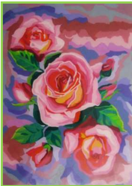
Рис.16 Лицевая сторона и готовая работа