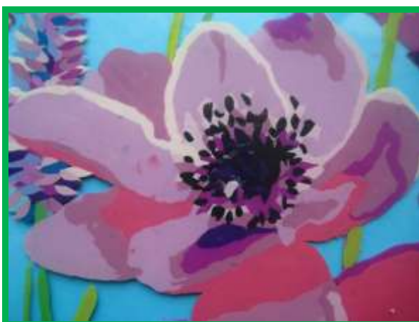
Рис.3 Лицевая сторона