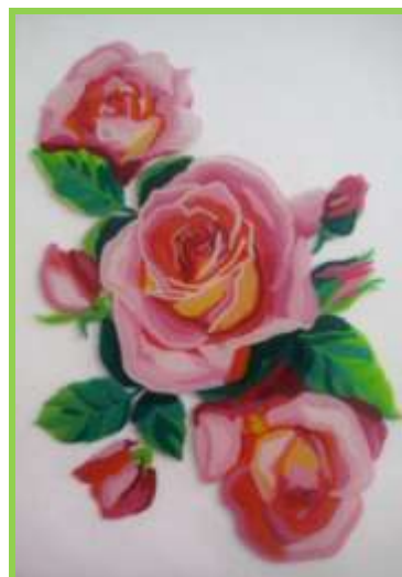
Рис.12 Лицевая сторона