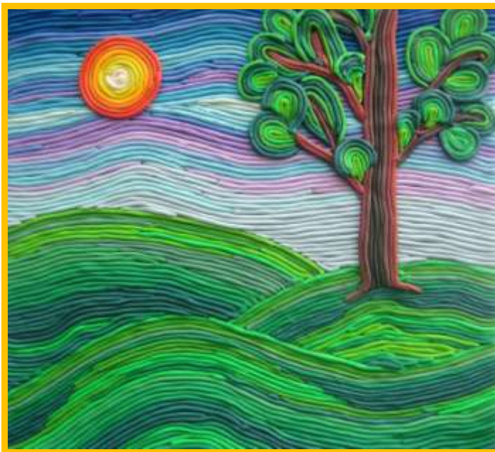
Работа Буториной А.