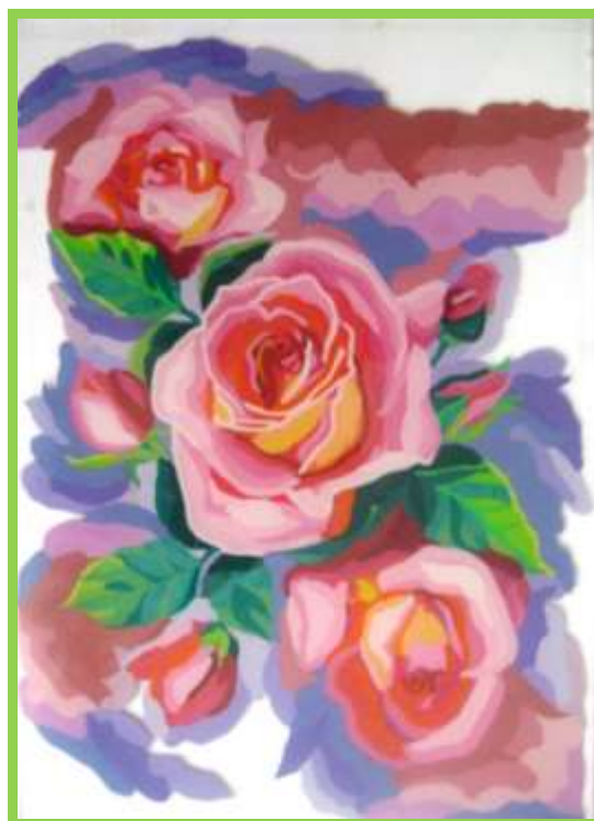
Рис.14 Лицевая сторона