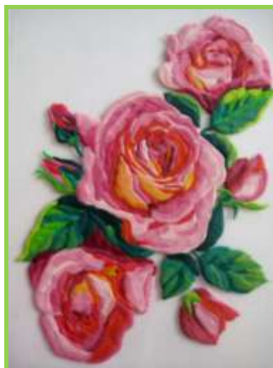
Рис.11 Изнаночная сторона