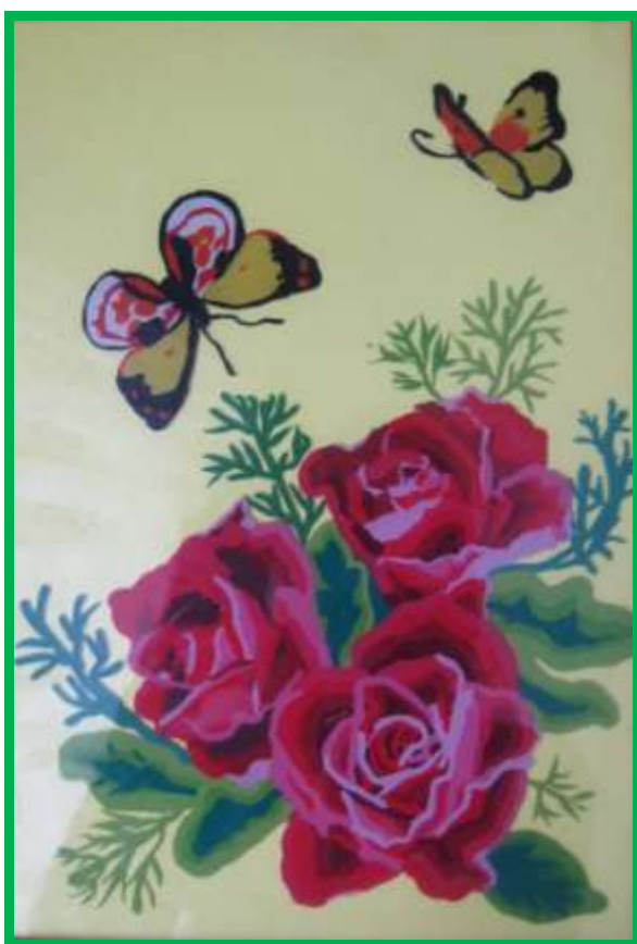
Рис.1 Лицевая сторона