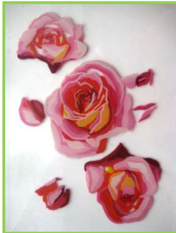
Рис.9 Лицевая сторона.

5. Далее постепенно переходим на полутона и тени. После цветов переходим к листьям, зелени. (Рис. 10,11,12)