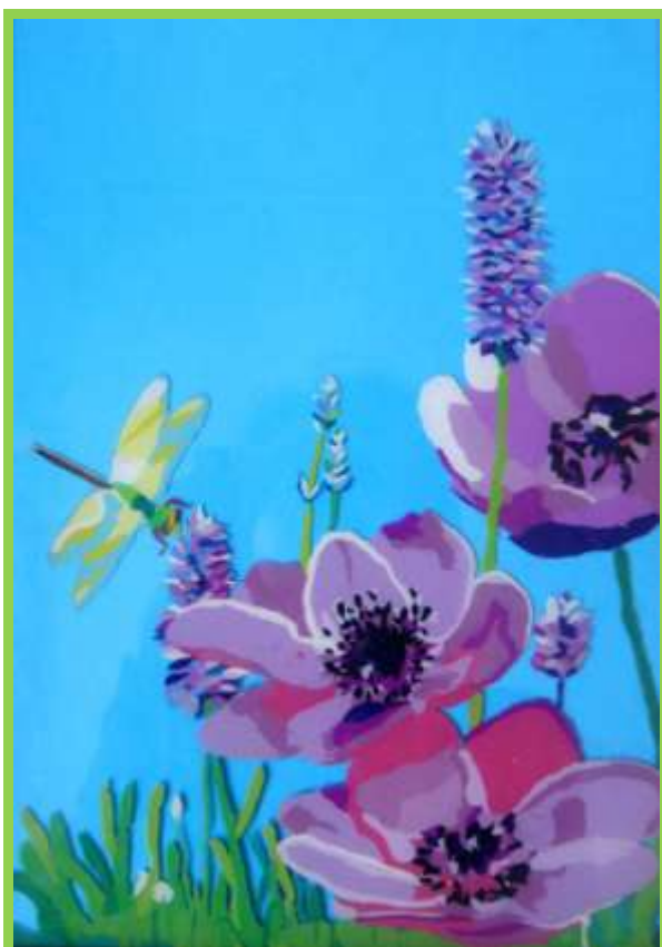
Рис. 1 Лицевая сторона