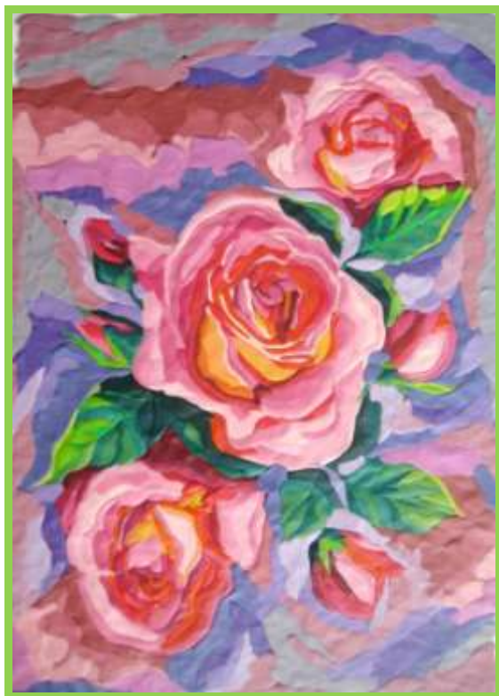
Рис.15 Изнаночная сторона