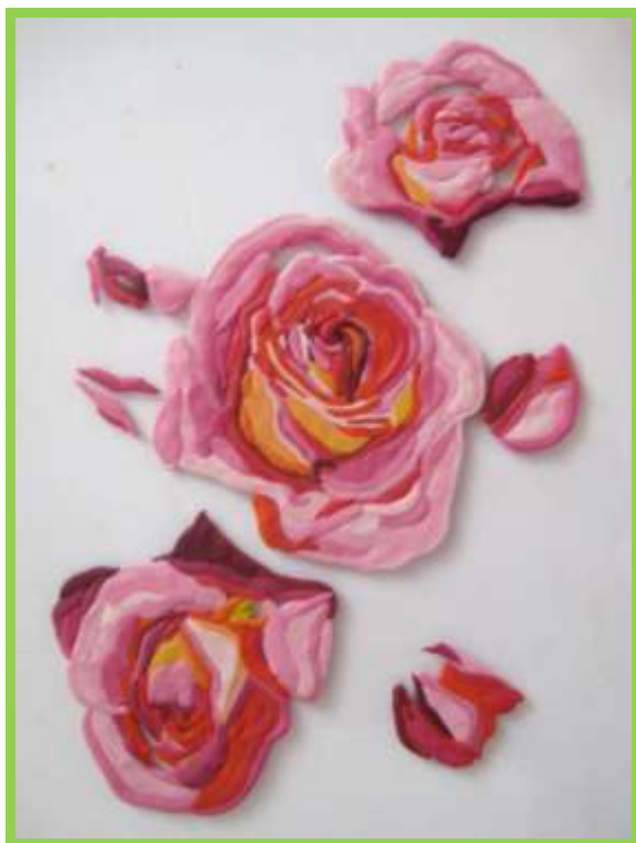
Рис.8 Изнаночная сторона

4. Во время работы постоянно можно переворачивать стекло и следить за результатом своего творения. (Рис.8,9)